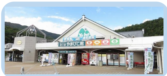
「道の駅」やまびこ館