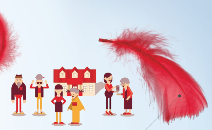
地域の居場所づくり

この羽根が、宮古を良くする。 This feather makes our town better.