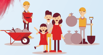
ボランティアさんの一生懸命な姿に 勇気と希望をもらいました