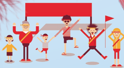
地域交流イベント