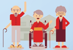
生活にはりができ健康になりました