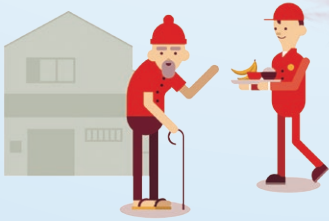
訪ねてくれるのを待っています